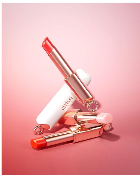
「Authentic Lip Balm」